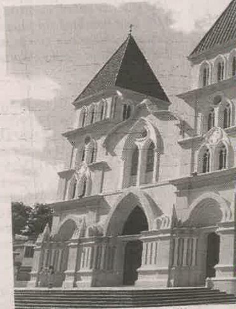
Catedral de Santiago Apóstol.

A propósito de la inseguridad ciudadana,